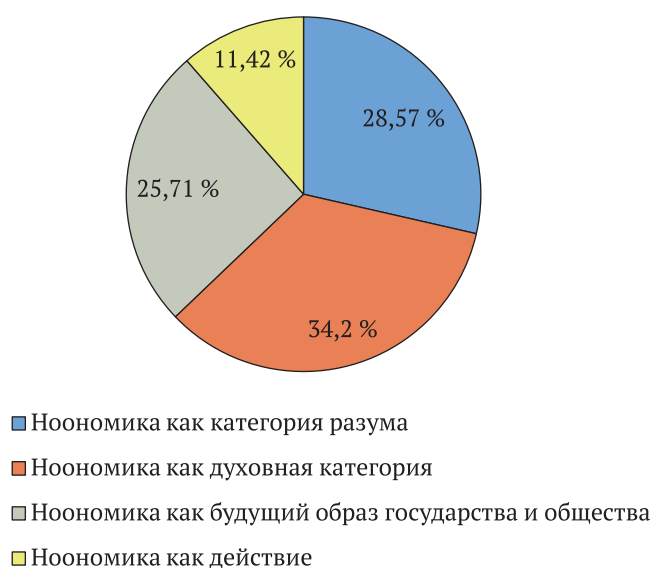
Диаграмма 1. Фреймовая организация концепта «ноономика»

С помощью методов когнитивного анализа были изучены аспекты-фреймы понятия ноономика, ядро которого составляет фрейм «ноономика как духовная категория» (34,2 %) , в его центре находится слот «неэкономическое (духовное) существование и развитие человека и общества» . Концептуальное поле ядра структурируется четырьмя слотами: высшая ценность, противоположность материальному, истина, культурная революция. Ближняя периферия включает в себя слот «ноономика как категория разума» (28,57 %) и слот «ноономика как инструмент создания образа будущего государства и общества» (25,71 %) . Дальняя периферия представлена слотом «ноономика как действие» (11,42 %) .