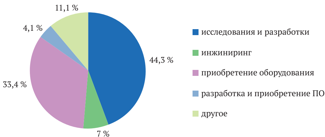
Рис. 2. Структура затрат на инновационную деятельность российского крупного и среднего бизнеса в 2020 году в процентах 3

На рисунке 2 приведена структура затрат на инновационную деятельность российского крупного и среднего бизнеса, которые в 2020 году составили 2,1 трлн рублей. Существенно, что более половины объема этих средств направлялось на исследования и разработки, причем 55 % – для предприятий промышленности 2 .